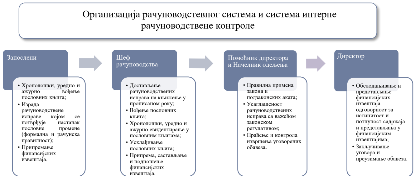
Слика број 1. Приказ организације рачуноводственог система и система интерне рачуноводствене контроле и поделе послова, надлежности и одговорности запослених и одговорних лица