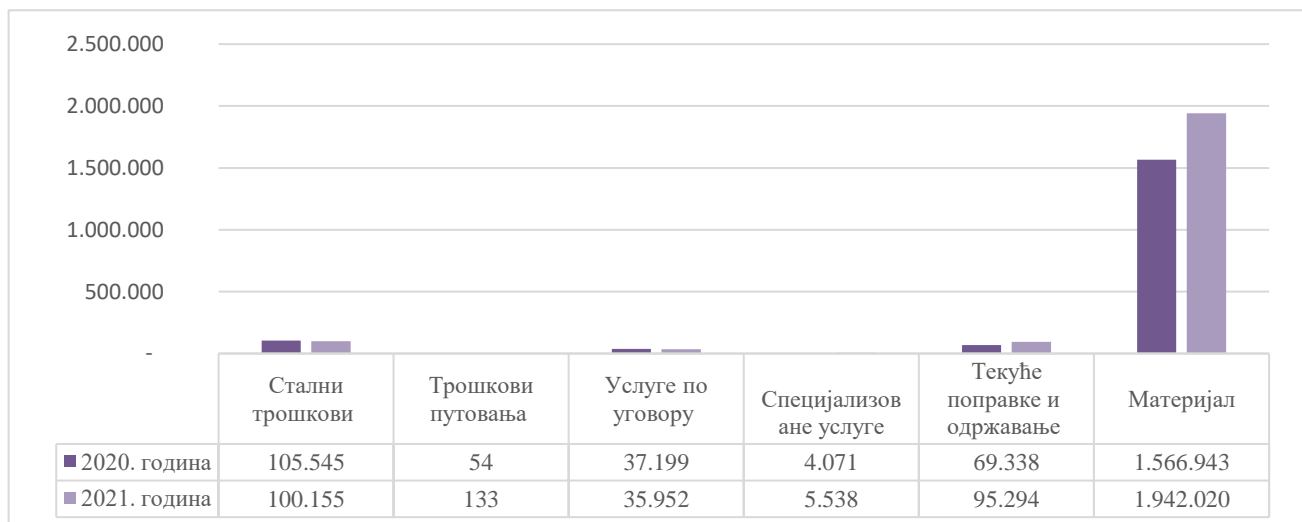
Слика број 2. Упоредни приказ расхода за коришћење услуга и роба у 2020. и 2021. години (у хиљадама динара)

Расходи за коришћење роба и услуга су за 22% већи у односу на 2020. годину.